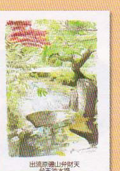
出流原磯山弁天池 弁天池水路