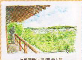
出流原磯山弁天池 最上階